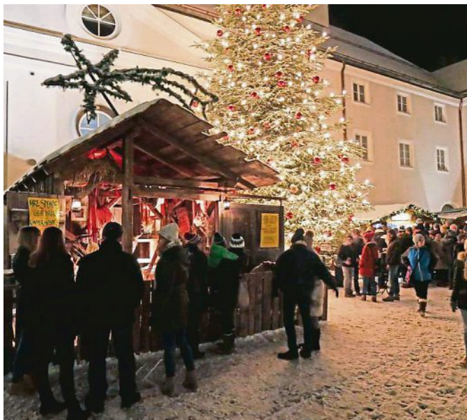
Romantisch ist die Klosterszenerie mit Beleuchtung.