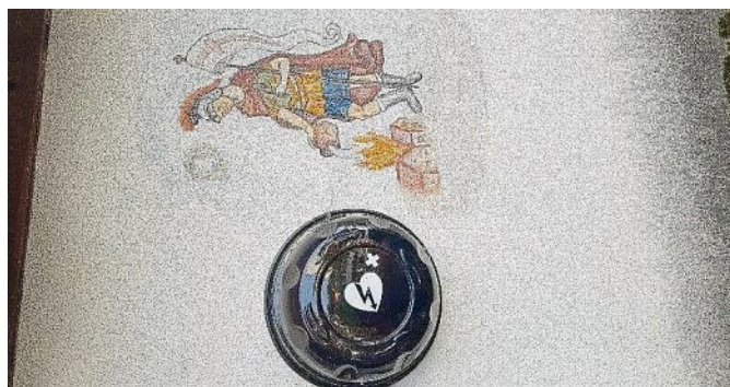
Der Defi am Feuerwehrhaus in Glonn.

Ab sofort ist in unserem Gemeindegebiet die Versorgung mit DEFIs (oder auch AED genannt) wieder ein Stück flächendeckender gesichert. Die neuen Geräte finden Sie an den Feuerwehrräumen in Glonn und Langenpettenbachin. Diese ergänzen die bereits vorhandenen Defibrillatoren am Feuerwehrhaus