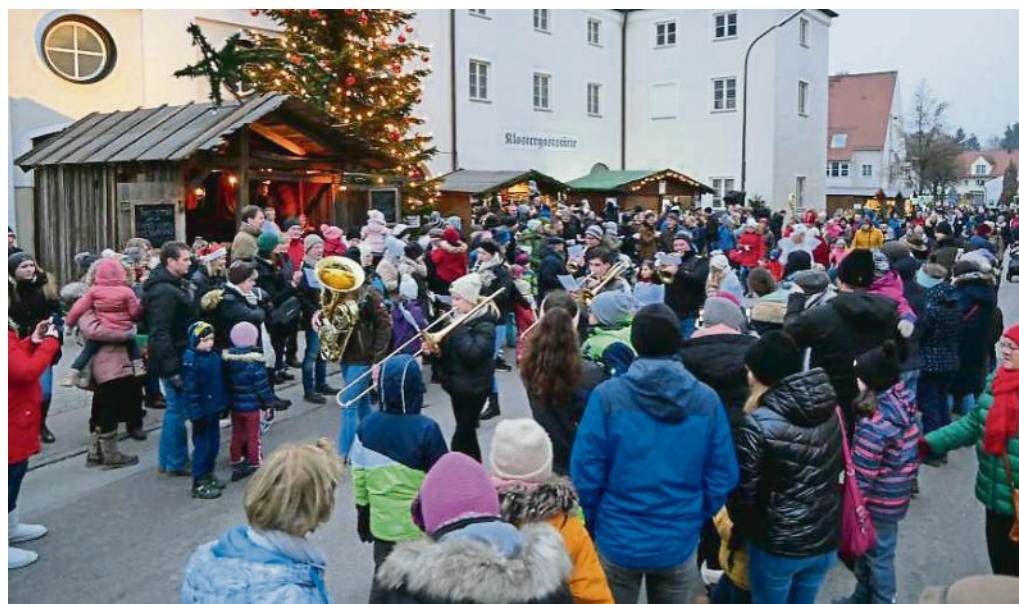
Der Nikolaus zieht ein – begleitet von viel Musik und seinen Engerl.

wollen das verhindern. Da muss wieder einmal der Kasperl helfen!