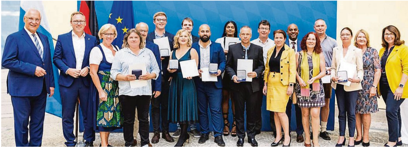
31 mutige Bürgerinnen und Bürgern erhielten bei einer Feierstunde die Medaille für Verdienste um die Innere Sicherheit für vorbildliche Zivilcourage.