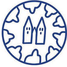
Runder Tisch Seniorer Markt Indersdorf