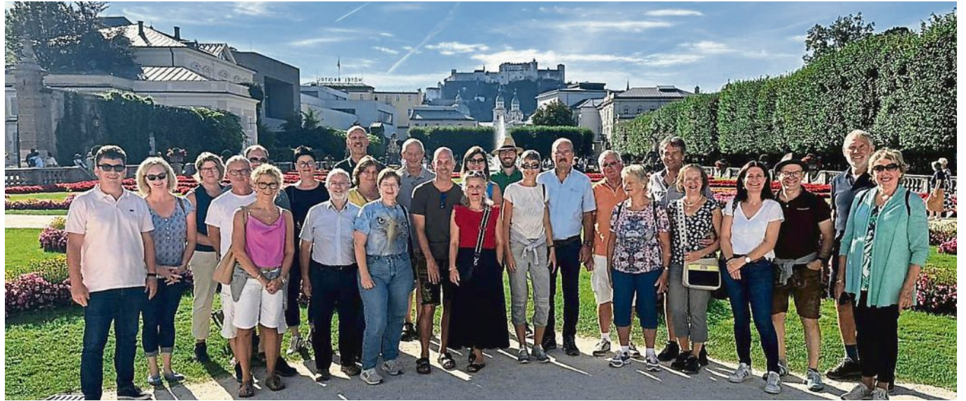
Bei schönstem Wetter unternahmen die Marktgemeinderäte eine Entdeckungstour durch Salzburg.

Im charmanten Lokal „Zum Eulenspiegel“ wurden die Räte mit einem Begrüßungstrunk erwartet, um dann wie einst Mozart zu schlemmen. Danach ließ man den Abend in