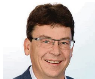
Franz Obesser 1. Bürgermeister

Ferner wird heuer noch die Straße nach Wengenhäusern saniert, die Ortsdurchfahrt von Straßbach erneuert und auch in Neuried wird eine Straße neu asphaltiert.