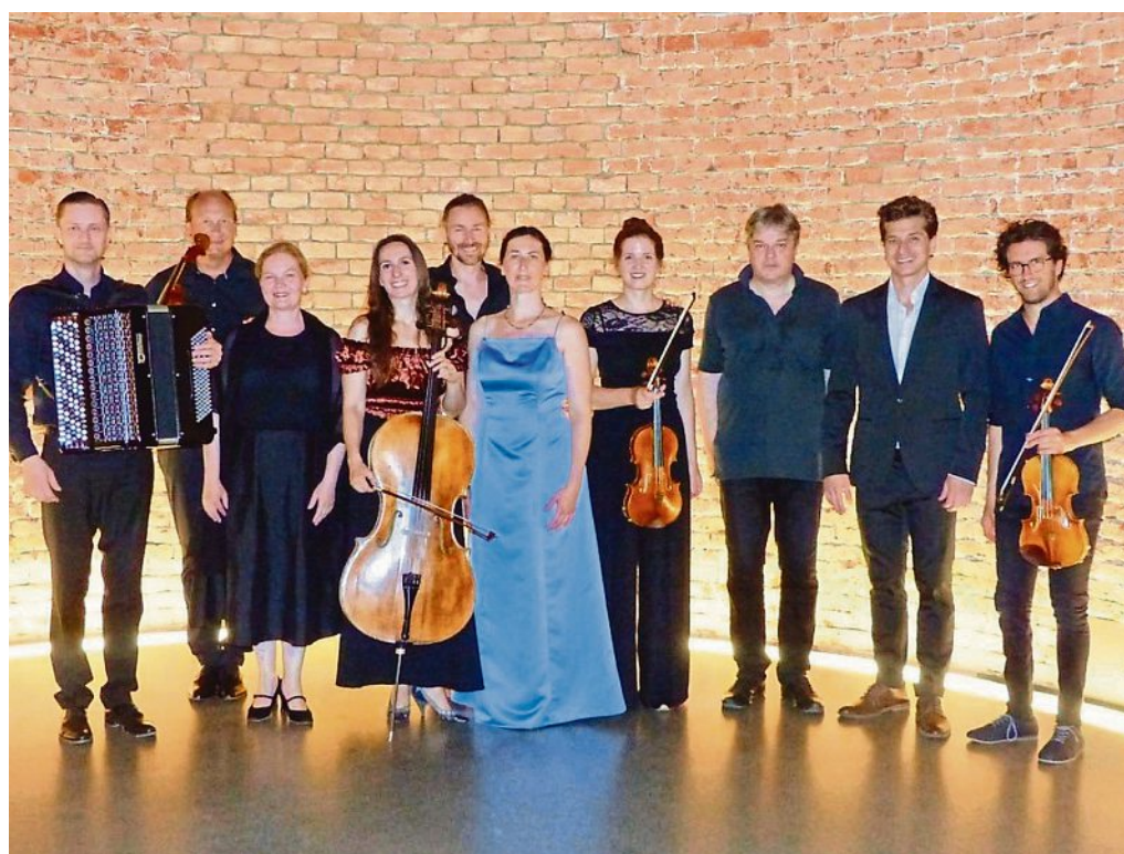
Das Ensemble 'Le nozze di Figaro'

Hoffnung auf Heilung hat am Ende nur derjenige, der sich dem Anderen in seiner ganzen Verletzlichkeit auszuliefern bereit ist.